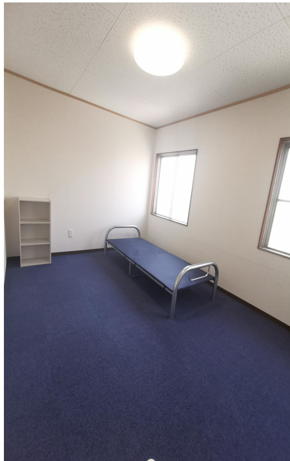
部屋タイプ①(リフォーム済)