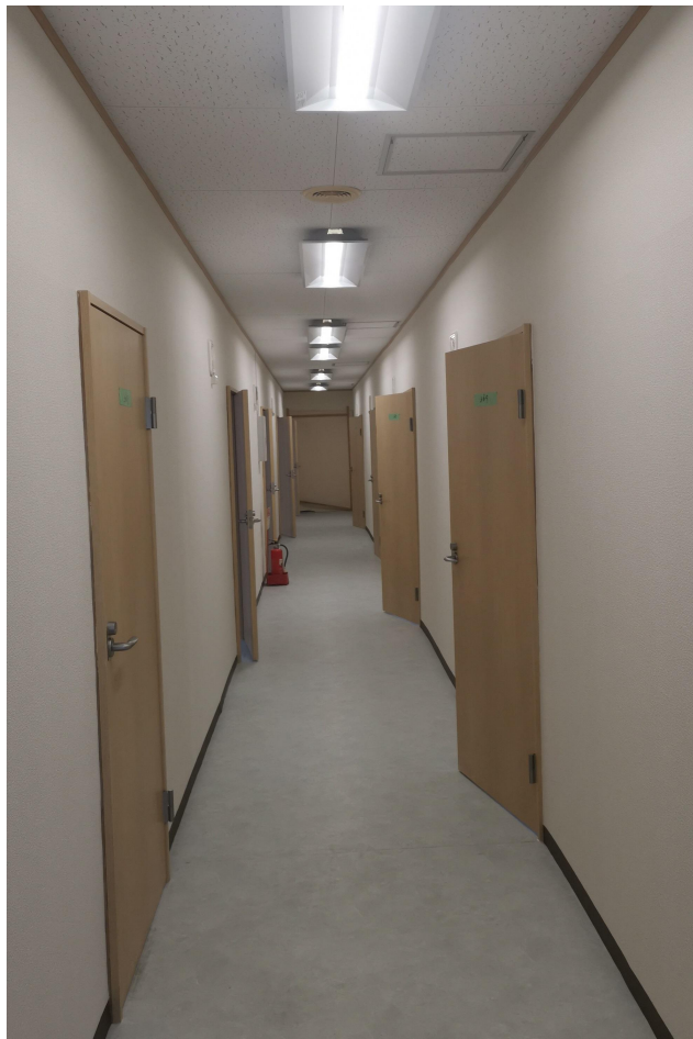
廊下(リフォーム済)